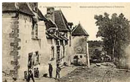
Manoir de Veygoux

Le Manoir de Veygoux, construit au XVII e siècle, le Manoir a accueilli l'enfance du Général Desaix, fidèle compagnon de Napoléon Bonaparte. Il accueille aujourd'hui un musée, propose des événements et des espaces de réception.