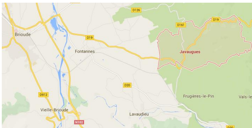
Situation de Javaugues