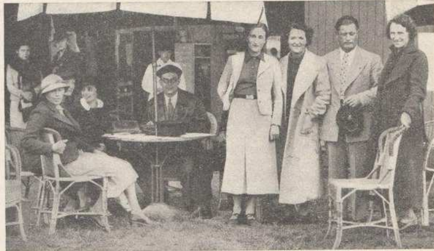
Romano R-80, R-82 1935